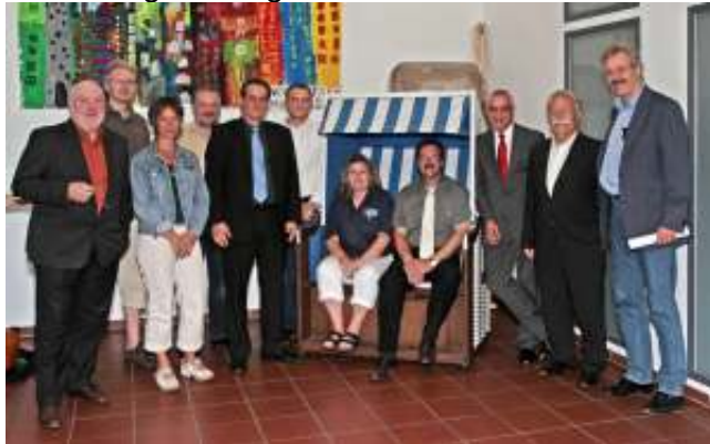
Die Mitglieder von links nach rechts:

Am 24. Juni 2009 wurde der Stiftungsrat neu gewählt, der am selben Tag den alten Vorstand einstimmig bestätigt hat.